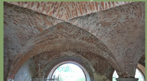
ökologisches, wiederverwendbares Material