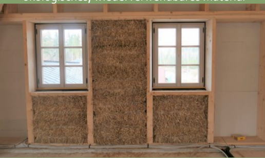
Strohballenbau, nachwachsende Baustoffe